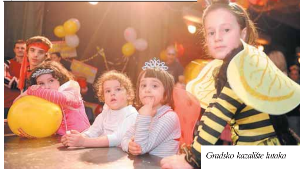
Dječji bal pod maskama